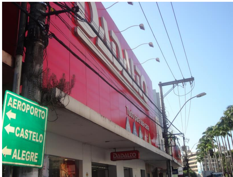
Aspecto geral da vizinhança