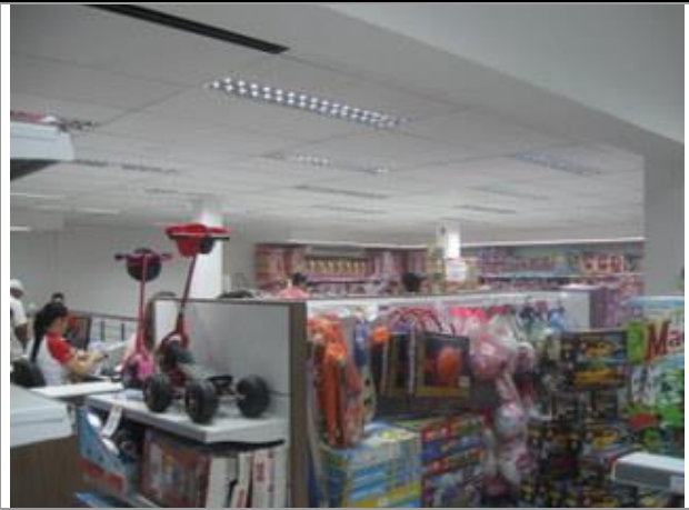
Vista Parcial Interna - Sobreloja