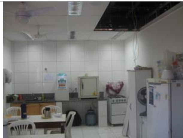
Vista Parcial Interna - Copa - Pavimento Superior