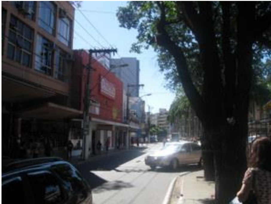
Vista geral da Rua Siqueira Campos.