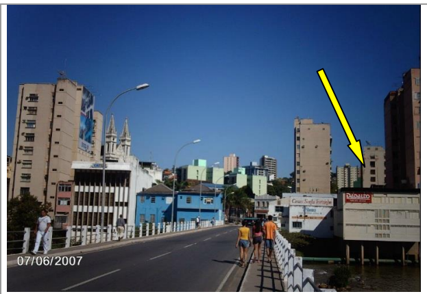
Fachada dos fundos.