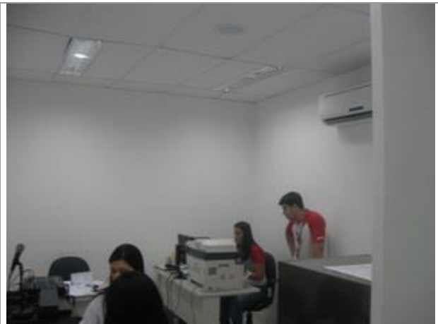
Vista Parcial Interna. - Sala - Pavimento Superior