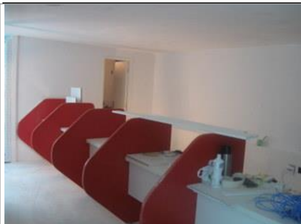
Vista Parcial Interna - Crediário - Sobreloja