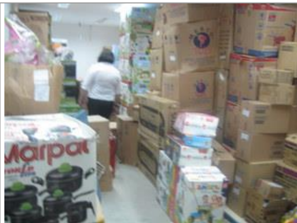
Vista Parcial Interna - Depósito - Pavimento Superior