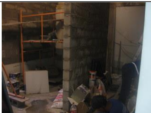
Vista Parcial Interna. - Obra - Sobreloja