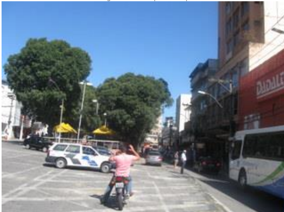
Vista geral da Praça Jerônimo Monteiro.