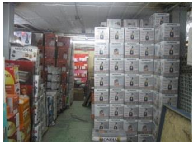
Vista Parcial Interna - Depósito - Subsolo