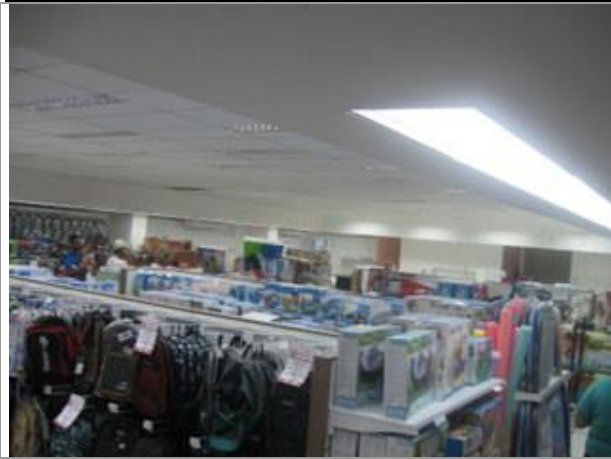
Vista Parcial Interna - Sobreloja