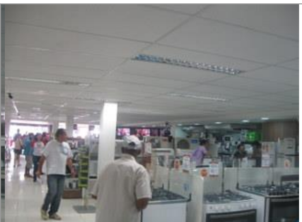
Vista Parcial Interna - Térreo - Loja.