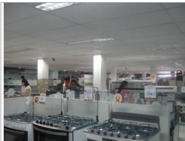
Vista Parcial Interna - Térreo - Loja.