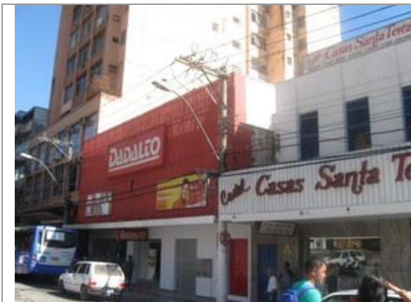
Fachada para a Rua Siqueira Lima.